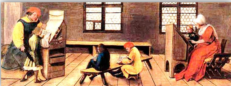
Doc 3 : Une leçon de lecture au 16 ème siècle.

Des savants font de nouvelles découvertes. Ambroise Paré révolutionne la chirurgie en découvrant comment ligaturer les artères.