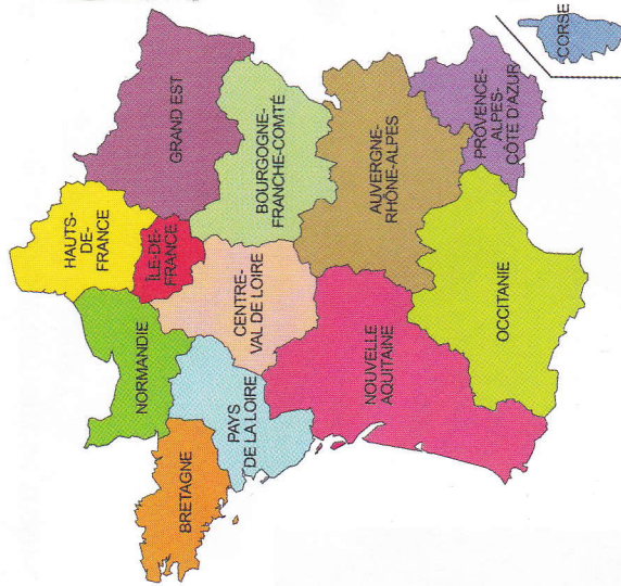
La France (métropolitaine) aujourd'hui.

→ 1) Compare le royaume de Clovis avec la France actuelle .