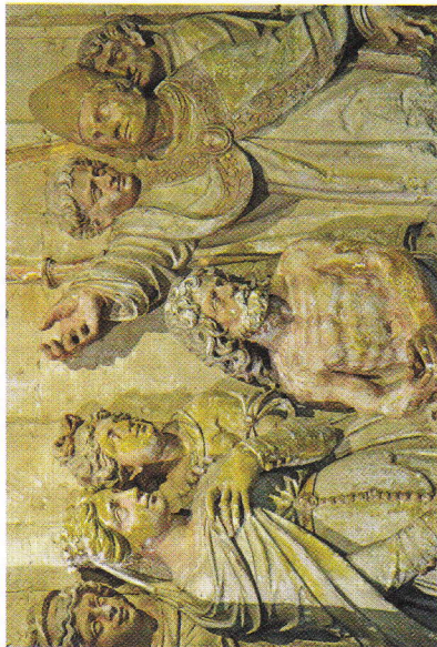
Le baptême de Clovis par l'évêque Remi (bas-relief).

→ 3) Trouve deux mots de la même famille que Franc .