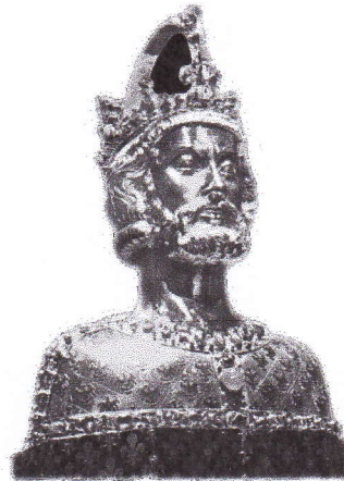
Doc 2 : Le buste de Charlemagne, trésor de la cathédrale d'Aix-la-Chapelle fait après 1349.