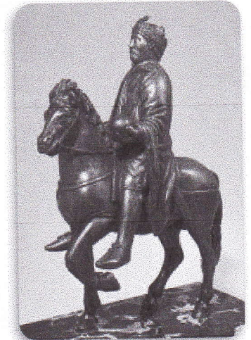
Doc 3 : Statue de Charlemagne, au musée du Louvre.